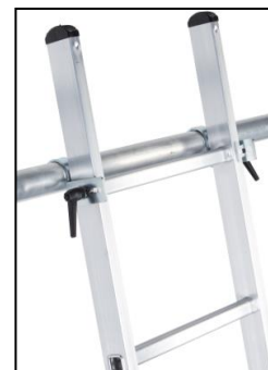
Куки за окачване