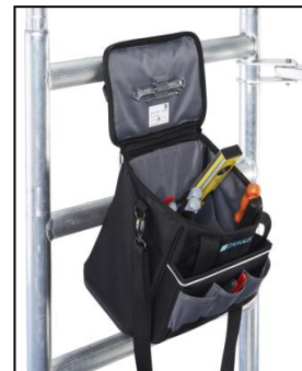
Чанта за инструменти