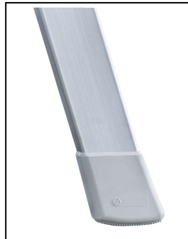
Накрайник, не оставящ следи