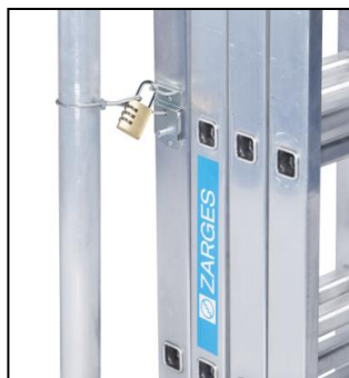
Защита срещу кражба