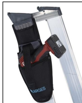
Чанта за безжичен винтоверт