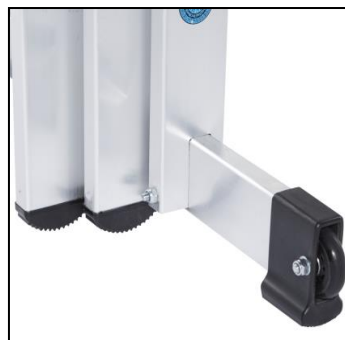
Колело в стабилизатора