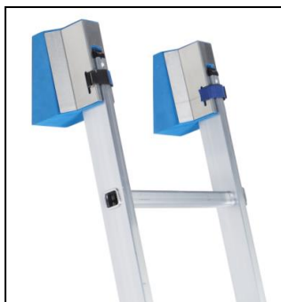
Опора за стена